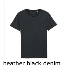
heather black denim