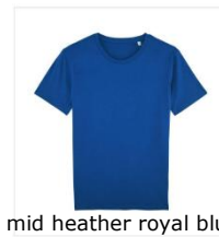
mid heather royal blue