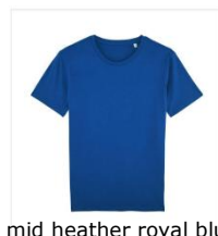
mid heather royal blue