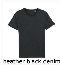
heather black denim